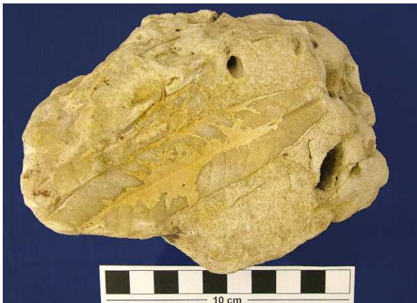
Blattabdruck im Sandstein

Führungen durch die Ausstellung sind auf Anfrage möglich. Kontakt: Kulturamt der Stadt Kaarst unter der Rufnummer 02131-987226.