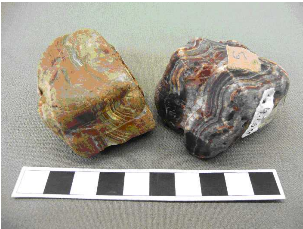
Achate aus dem Hunsrück

Die wissenschaftliche Bearbeitung der Bachmannschen Sammlung durch die Geologen Holger Kels und Georg Waldmann begann 2005. Im Laufe der Zeit ergaben sich zahlreiche Fragen für die weitere geowissenschaftliche Forschung. Infos: www.rheingeroelle.de