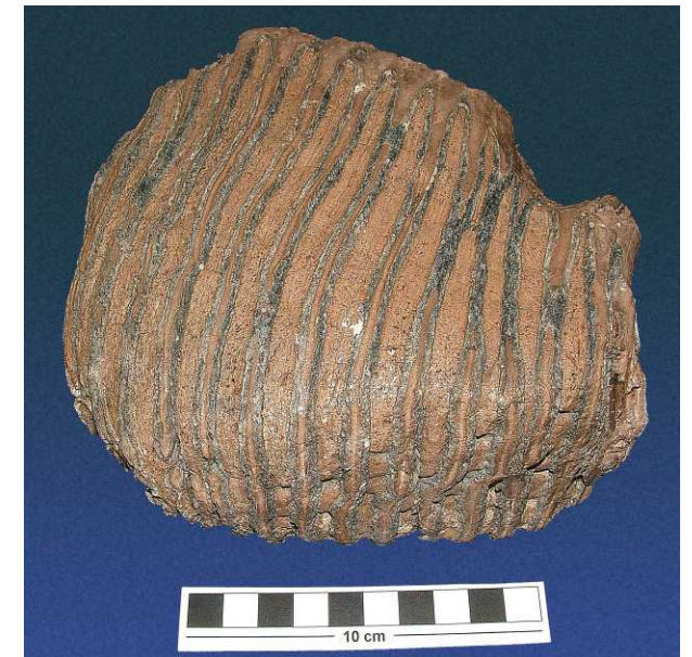
Backenzahn eines Mammut